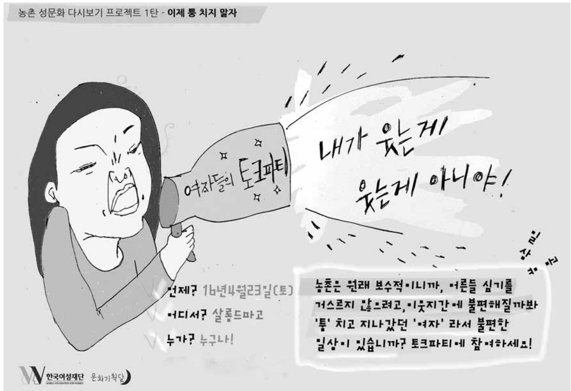
농촌 성문화 다시보기 프로젝트 1탄 - 이제 통 치지 말자

할의 명확한 구분, 일상적인 술자리와 친밀함속에 담긴 음담패설은 농촌이 의례 그거려니 하며 참고 견디는 귀농귀촌한 여성들에게 통과외례처럼 받아들여졌다.